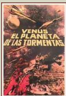
La planète des tempêtes - de Pavel Klouchantsev (en 1ère vision à Clermont-Fd)