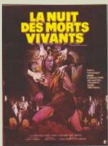
La nuit des morts-vivants - de George Romero