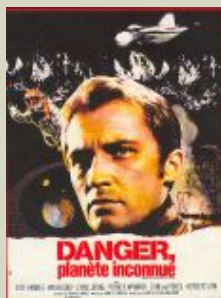
Danger planète inconnue - de Robert Parrish