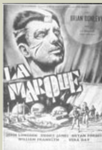
La marque (Quatermass 2) - de Val Guest