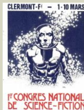
Affiche de Caza

Clermont-Ferrand - 1 au 10 mars 1974 organisé avec les membres du club "Promotion du Fantastique"