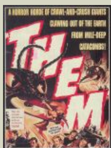
Des monstres attaquent la ville - de Gordon Douglas