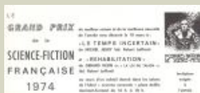
Le carton d'invitation