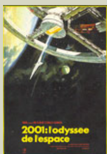
2001, l'odyssée de l'espace - de Stanley Kubrick