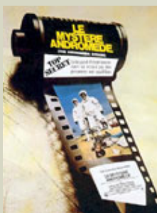
Le mystère Andromède - de Robert Wise