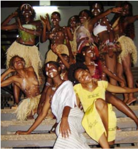
Les cordons dorés